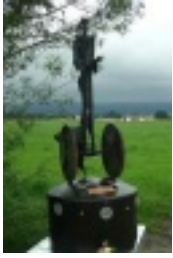
Hörmahnmal in Salzburg zum Gedenken an die Opfer des Nationalsozialismus, © Radiofabrik Community Media Association Salzburg

Sinti und Roma hatten in Deutschland schon früh immer wieder unter sozialer Stigmatisierung und Verfolgung zu leiden. Im Heiligen Römischen Reich waren sie noch offiziell geduldet, doch der Freiburger Reichstag erklärte Angehörige der ethnischen Minderheit im 15. Jahrhundert schließlich als vogelfrei (also vollkommen rechtlos). Als Begründung dienten Vorwürfe, sie hätten für die Türken spioniert. Im späteren Deutschen Reich wurden die Sinti und Roma ab 1899 offiziell registriert und systematisch als gesellschaftliches Problem stigmatisiert und bekämpft.