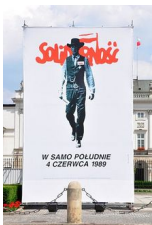
Wahlplakat der Solidarnosc-Bewegung.

Das Jahr 1989 markierte für alle drei Länder einen tiefen Einschnitt. In Polen war es schon im Jahr 1980 durch die freie Gewerkschaft Solidarnosc und ihres Führers Lech Walesa zu einer starken Opposition gegen das kommunistische Regime gekommen.