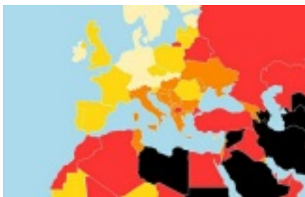
Index zur weltweiten Pressefreiheit

Wirkliche journalistische Unabhängigkeit steht in Bulgarien oft nur auf dem Papier. Damit ist die Glaubwürdigkeit des Journalismus bei der Bevölkerung sehr gering. Insgesamt sind die Eingriffe in die Pressefreiheit in Bulgarien eher wirtschaftlich denn politisch motiviert. Dies macht die Situation der Presse aber keinesfalls besser als in Polen und Ungarn. „Reporter ohne Grenzen“ beklagt, dass in Bulgarien die Presse besonders stark von Oligarchen dominiert wird und dass es keine Transparenz über die Medienbesitzer gibt. Die besonders schwierige wirtschaftliche Situation der Journalisten in Bulgarien macht diese noch erpressbarer als ihre Kollegen in Ungarn und Polen.