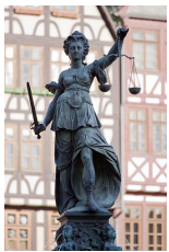
Justitia in Frankfurt.

Massiv verschlechtert hat sich das Verhältnis zwischen Exekutive und Legislative allerdings erst mit dem Wiederantritt der PiS Regierung, die diesmal mit einer absoluten Mehrheit im Parlament ausgestattet ist. Der PiS Vorsitzende Kaczynski hat erklärt, dass für ihn Entscheidungen des Verfassungsgerichtes nicht bindend seien. Ausgangspunkt des Konfliktes war eine von der Regierung geplante Reform des Verfassungsgerichtes. Das Verfassungsgericht sah dadurch seine Arbeit gefährdet, zum Beispiel durch die Bestimmung, dass künftig die Verfassungsrichter nur noch mit einer Zwei Drittel Mehrheit statt einer einfachen Mehrheit Beschlüsse fällen könnten. Dies würde die Arbeit des Verfassungsgerichtes ebenso behindern wie die Bestimmung, dass das Verfassungsgericht die Fälle in der zeitlichen Reihenfolge ihrer Einreichung und nicht mehr ihrer Bedeutung entsprechend behandeln müsse.