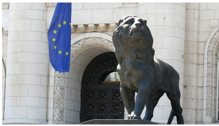
Gericht in Sofia.

Aber auch in Bulgarien ist das Verhältnis zwischen Justiz und Politik problematisch. So gibt es immer wieder den Versuch vonseiten der Politik Gerichtsentscheidungen im eigenen Sinn zu beeinflussen.